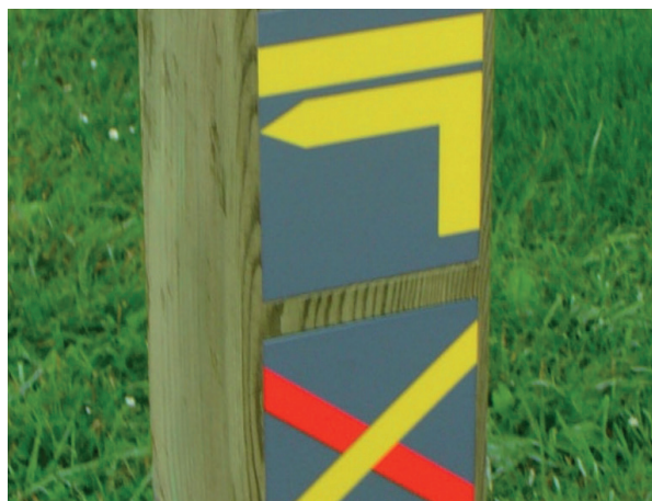
■ Jalon avec marquage imprimé numériquement.