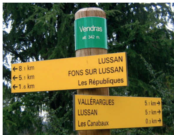
■ Panneaux directionnels gravés et peints