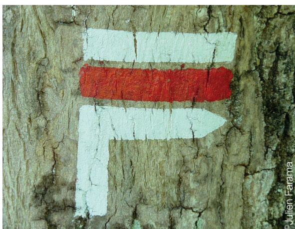
■ Balisage GR® peint sur un arbre